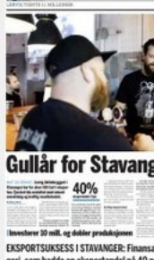
Gullår for Stavangerbryggeri Eksportsuksess i Stavanger: Finansavisen skrev 16. februar om Lervig Aktiebryggeri, som hadde en eksportandel på 40 prosent i fjor.